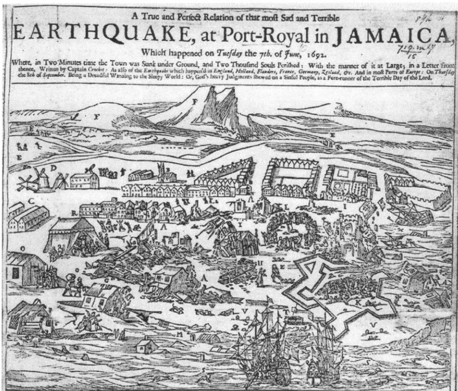
Dobový leták popisující zničení přístavu Port Royal 7. června 1692.

Přístav založili Španělé v roce 1518 na jihovýchodě Jamajky a brzy se toto místo stalo důležitým obchodním uzlem v karibské oblasti. Mělo výhodu v poloze na konci několika kilometrů dlouhého písčitého poloostrova. Lodě tak bez potíží vplouvaly do přístavu bez nebezpečí nárazu do pobřežních skal. V roce 1655 se stala Jamajka anglickou kolonií. Španělská flotila na to odpověděla blokováním přístavu Port Royal. Angličané přistoupili k netradičnímu řešení a pozvali piráty a bukanýry z celého Atlantického oceánu, aby připluli město bránit. Na oplátku